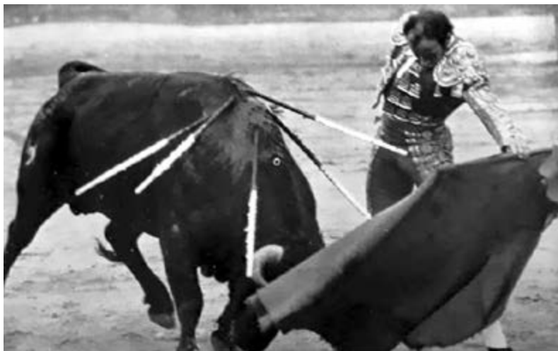
Fotografía 2.- Al natural ante un toro de Saltillo de Charco Blanco. Las Ventas, Madrid, 1974.