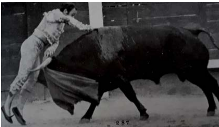
Fotografía 3.- Estocada. Madrid.