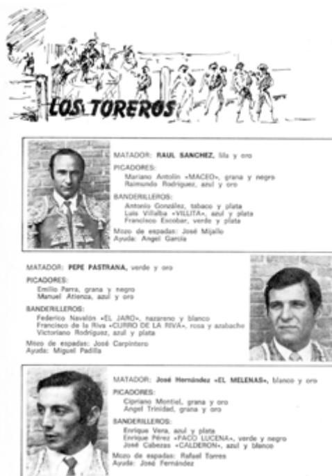
Ilustración 1.- Toreros Programa Corrida 26 de septiembre de 1982. Madrid.